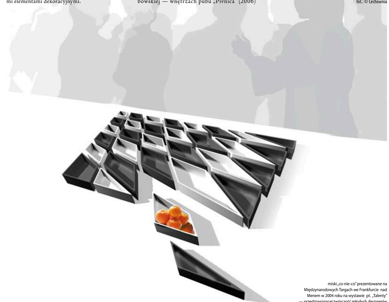
miski „co-nie-co” prezentowane na Międzynarodowych Targach we Frankfurcie nad Menem w 2004 roku na wystawie pt. „Talenty” — przedstawiającej twórczość młodych designerów